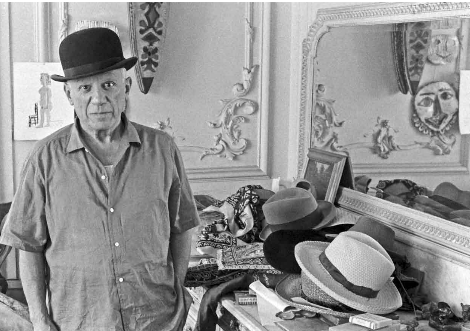
Picassoliebte es, die Wirkung einer neuen Kopfbedeckung zu erproben. Neben ihm sieht man eine Sammlung von Hüten, mit denen er seine Freunde durch wechselnde Verkleidungen amüsieren konnte. Villa «La Californie», Cannes 1955

drucksstarken, teils sehr persönlichen Szenen und Episoden – mal im Großformat, mal gefällig klein, aber fast immer in schwarz-weiß - allgegenwärtig und macht Picasso mit all seinen kontroversen Facetten begreifbar. Begreifen – das nimmt The Picasso Story wörtlich und gibt den Besuchern Impulse, sich auf Picasso einzulassen, den „Mann hinter