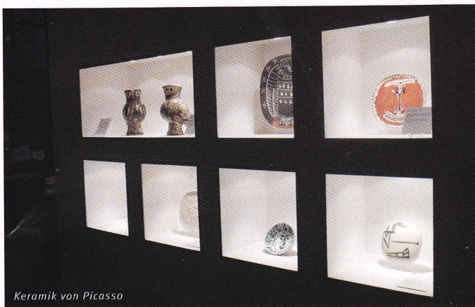
Keramik von Picasso