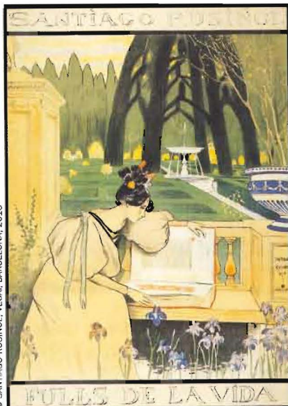
Santiago Rusiñol i Miquel Utrillo. Cartell anunciador del llibre Fuls de la vida , de Santiago Rusiñol, c. 1898.